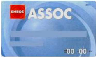
生協価格適用(職員生協HP参照)