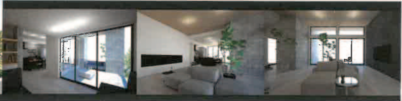
※このパースは完成イメージ図です。パースと現物が相違する場合、現状を優先します。