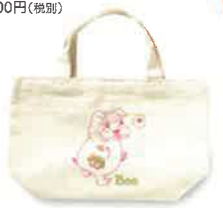
鳥田ゆか ランチトート 2,000円(税別)