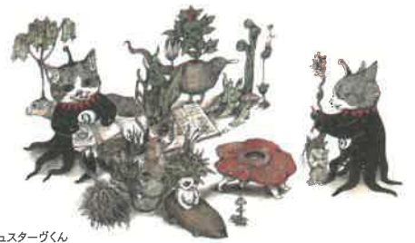
ギュスターヴくん