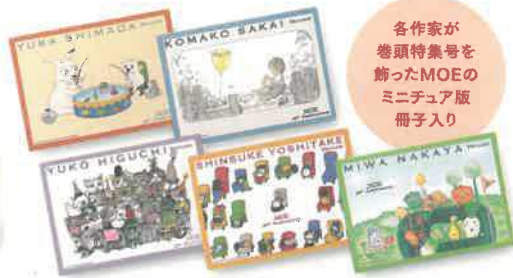
ポストカードセット 各1,600円(税別)