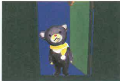
よるくま クリスマスのまへのよる