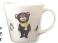
酒井駒子 よるくま クリスマスのまへのよる マグ 1,500円(税別)