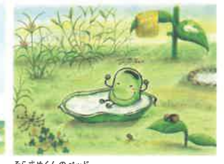
そらめくんのベッド