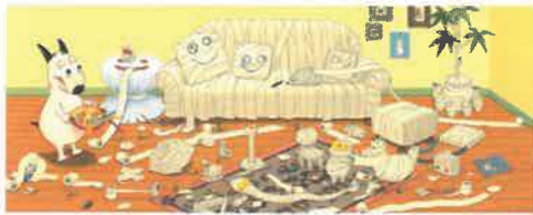
バムとケロのさむいあさ