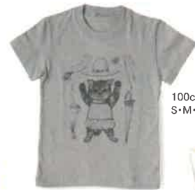
ヒグチュウコ きせかえねこTシャツ (ホワイト、グレー) 100cm・120cm 各2,000円(税別) S・M・ユニセックスM・ユニセックスL 各2,300円(税別)