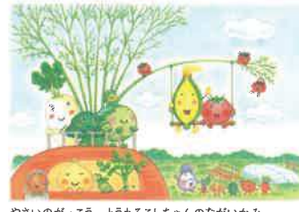
やさしいのがっこう とうもろこしちゃんのながいかみ

『りんごかもしれない』 『りゅうがいます』 『もうぬげない』 『なつみはなんにでもなれる』 『つまんない つまんない』 『それしかないわけじゃないでしょう』