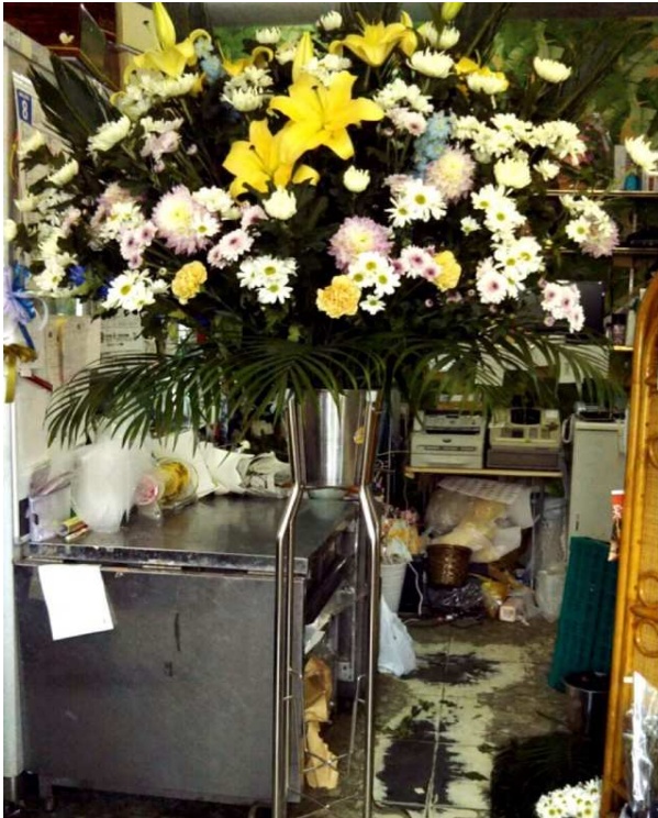
2. 生花スタンド1段 一般価格:15,000円(税別)