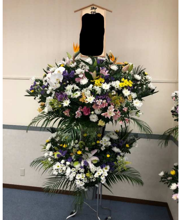
3. 生花スタンド2段 一般価格:20,000円(税別)