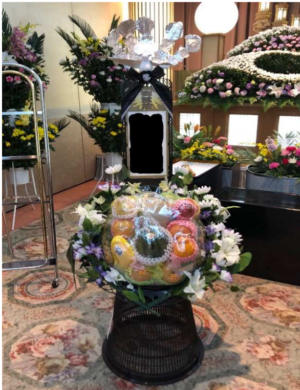
5. 果物籠盛 一般価格:15,000円(税別)