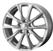
JOKER GLIDE (ジョーカーグライド)