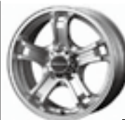
KEELER FORCE (キラーフォース) SUV/4×4用