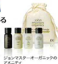
ジョンマスターオーガニックの アメニティ