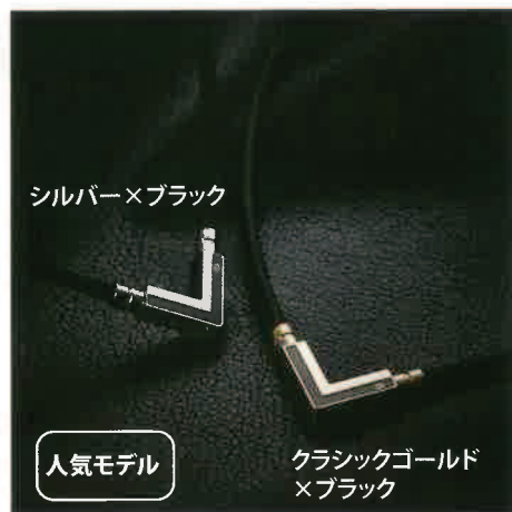
シルバー×ブラック