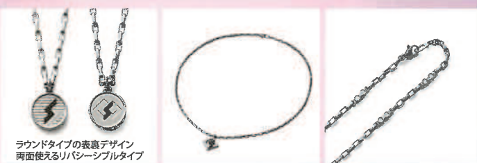
ラウンドタイプの表裏デザイン 両面使えるリバーシブルタイプ