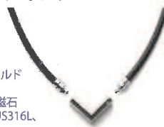
男性モデル首回り36cm MLLL

医療機器認証番号: 226AGBZX00008A02 シルバーとクラシックゴールド共通スペック サイズ(約): M43cm 重量20g、L47cm 重量21g LL51cm 重量22g 材質: <ネックレス部分> 樹脂コーティング磁石(65ミリテスを10mm間隔でN極S極交互配列) <トップ・ジョイント> SUS316L (クラシックゴールド: イオンプレATING)