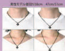
男性モデル首回り38cm 47cm/51cm 女性モデル首回り31cm 47cm/51cm

すべての金属パーツに高機能素材である純チタンを使用。金属アレルギーリスクが極めて低く、超軽量・高耐久性・高耐食性を兼ね備えた高スペックモデル。質感にごこだわった仕上げとデザインでスポーツシーンをよりスタイリッシュに。