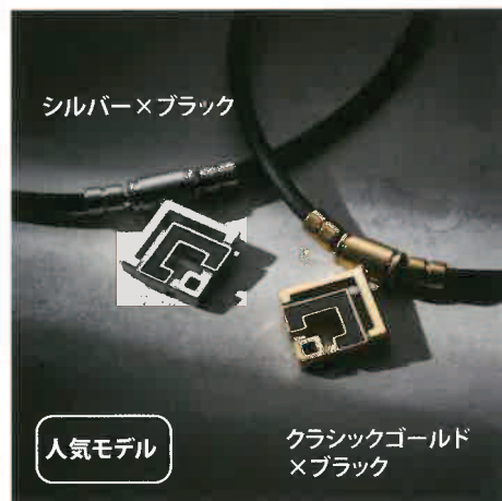
シルバー×ブラック