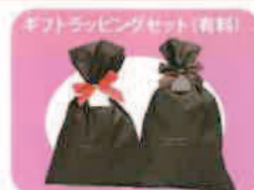
リボンレッド・ブラウン

※商品の特性上返品・交換はご容赦願います。 ただし、お届け商品に内容相違、破損等があった場合は、商品到着後、1週間以内にご連絡ください。 良品商品と交換対応致します。 チラシに掲載の商品は印刷物のため、現物と多少異なる場合がございます。