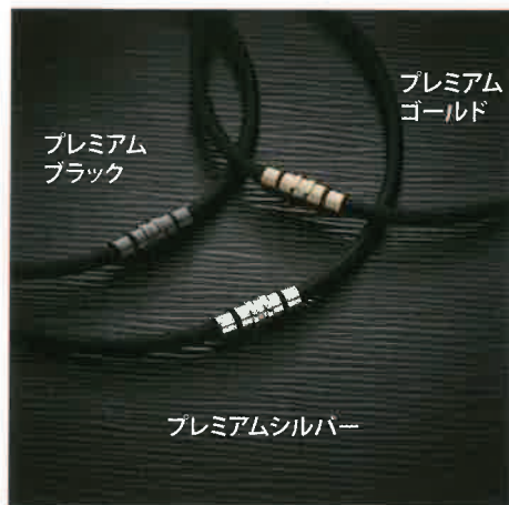
プレミアム ゴールド

「コラントッテ ネックレス クレスト」のプレミアムカラーシリーズ。スポーツシーンにも適したモデルです。