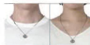
男性 首回り35.5cm 女性 首回り29cm

ファッションの一部としてさりげなく着用するだけで首・肩のコリケアができるチェーンタイプの磁気ネックレス。素材には肌に優しくさびにくいステンレス(SUS316L)を採用しています。