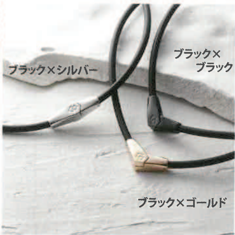
ブラック×シルバー

トップジョイントが可変式で、気分やシーンに合わせて2つの形を楽しめます。スポーツシーンにも適したモデルです。