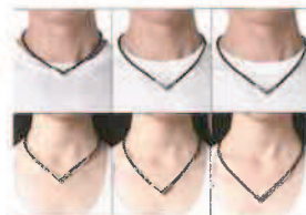
女性モデル首回り31.5cm MLLL

TAO ネックレス史上最高スペックを誇る「TAO ネックレス α ARAN」。 トップアスリートの使用率も高いモデルです。