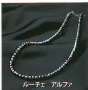
ルーチェ アルファ