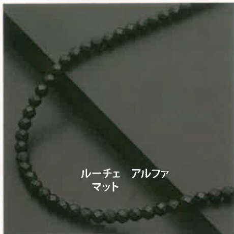
ルーチェ アルファ マット

全周磁石タイプの磁気ネックレスでは最高スペック100ミリテスラの磁石を採用。 シンプルベーシックなデザインです。