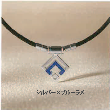
シルバー×ブルーラメ

細いループのスリムタイプに「ARAN mini」が登場。女性にも似合うカラーリングとデザインが人気です。